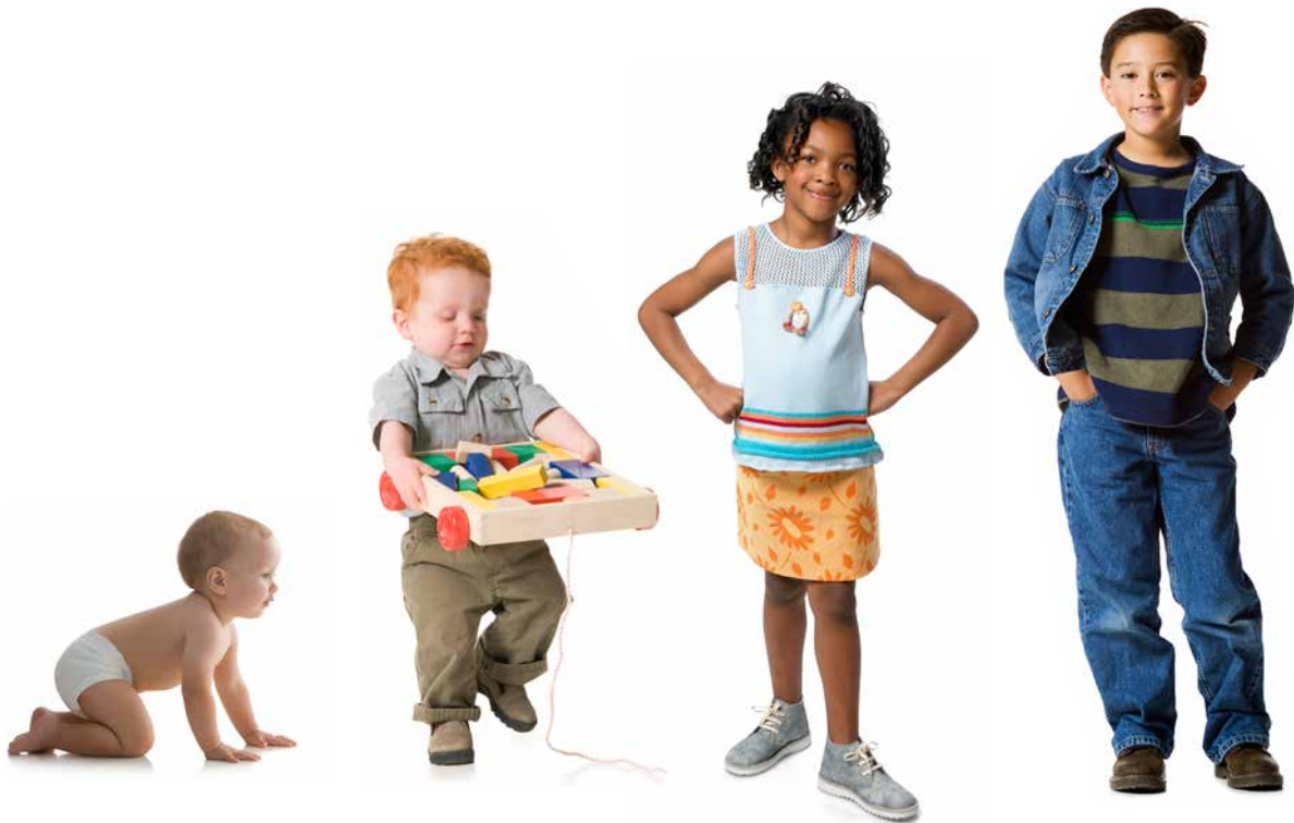
ናይቶም ክሰርሑ ወይ ዚመሃሩ ወከዲ ህጻን