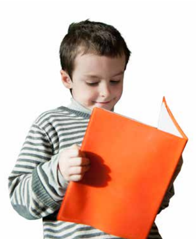
ቅድመ ትምህርቲ 1 - 6 ዝሰድሙኦም ኸቲ ኮምፎን ነቲ ክፍኪት ይውስኖ