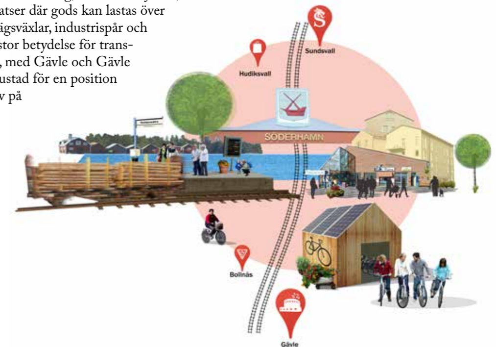
Ida Larsson, White arkitekter

2040 har Söderhamn stärkt sin roll som strategisk nod för hållbar transport till havs och på land.