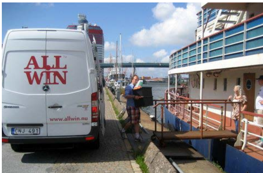
I stället för att bra mat slängs hämtas den av Allwin som ger den till olika hjälporganisationer.

År 2011 levererade företaget Allwin 200 ton mat till dem som behöver den mest. 200 ton mat som annars hade kastats.