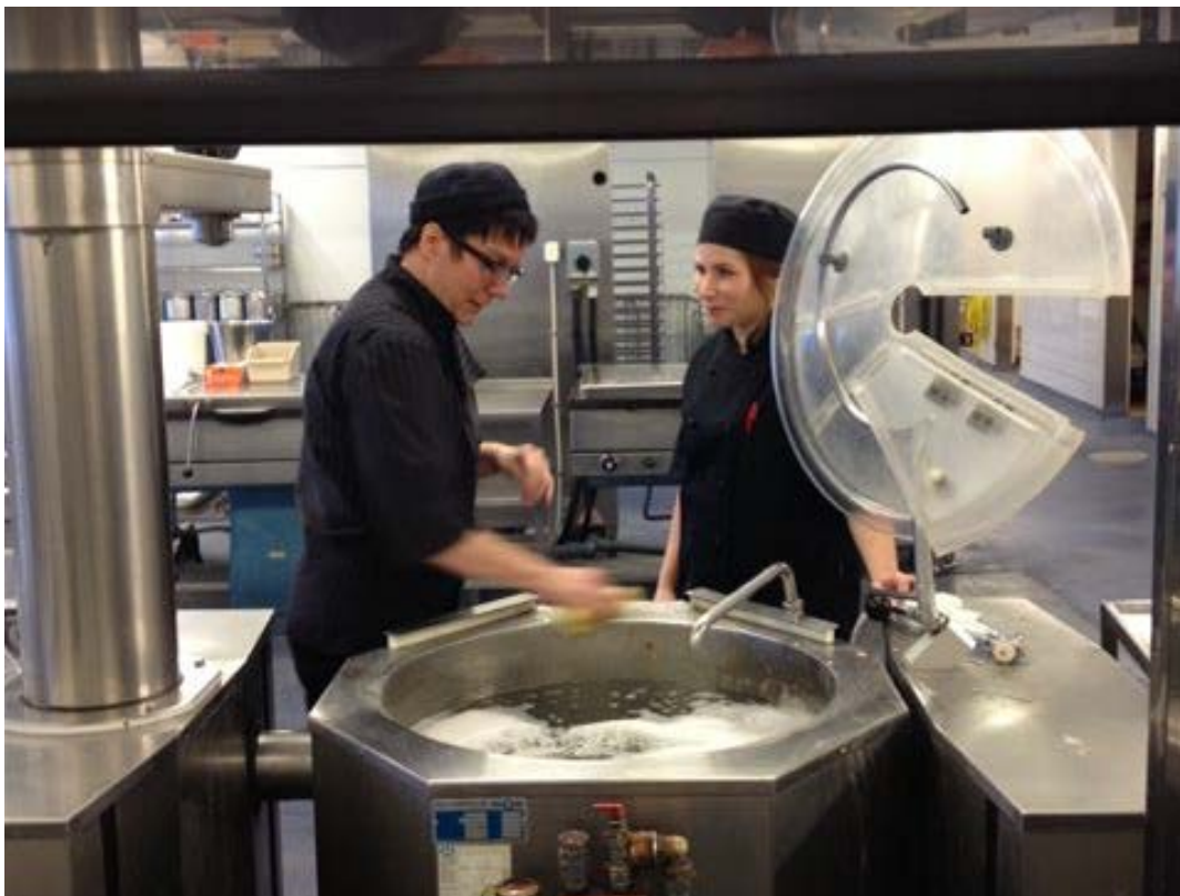
På äldreboendet Allegården ska man bygga om köket så att man på plats kan tillaga och förvara maten i februari 2013.

År 2008 togs beslutet i kommunfullmäktige – idag är det bara en skola kvar att renovera innan all mat lagas på plats i Tibros skolor, förskolor och äldreboenden. Nu när maten lagas nära gästen har matens kvalitet och yrkesstoltheten bland personalen ökat, och det har blivit lättare att själv påverka mängden matsvinn.