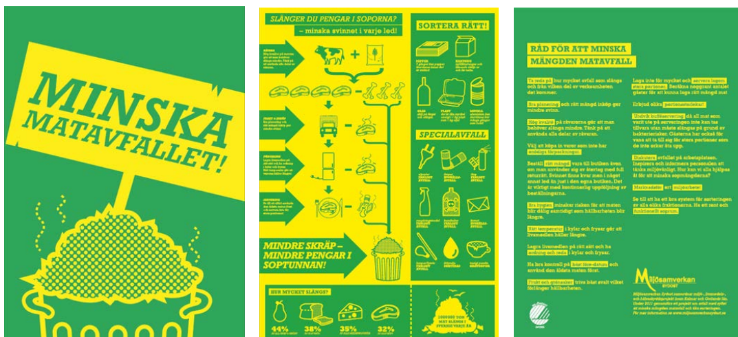
2011 tillverkade Miljösamverkan sydost en informationsbroschyr om hur man minskar matsvinnet.

År 2011 genomförde Miljösamverkan Sydost en kampanj för att minska matsvinnet riktad till livsmedelsföretagare. Man tog fram en informationsbroschyr och genomförde tre temadagar.